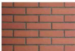
Кирпич светло-коричневый лицевой окрашенный в массе