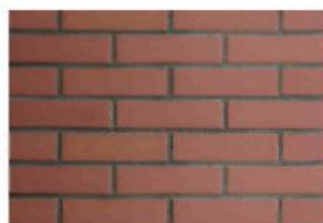
Кирпич коричневый лицевой окрашенный в массе