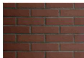
Кирпич темно-коричневый лицевой окрашенный в массе

Использование кирпичей различных оттенков делает кирпичную стену дома пестрой и яркой.