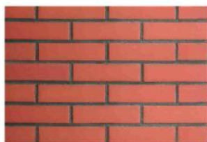
Кирпич красный лицевой окрашенный в массе

Коричневый цвет и его производные наиболее привлекательны в ведении баварской кладки. Различия в полутонах одного цвета наполняют внешний вид дома новыми красками.